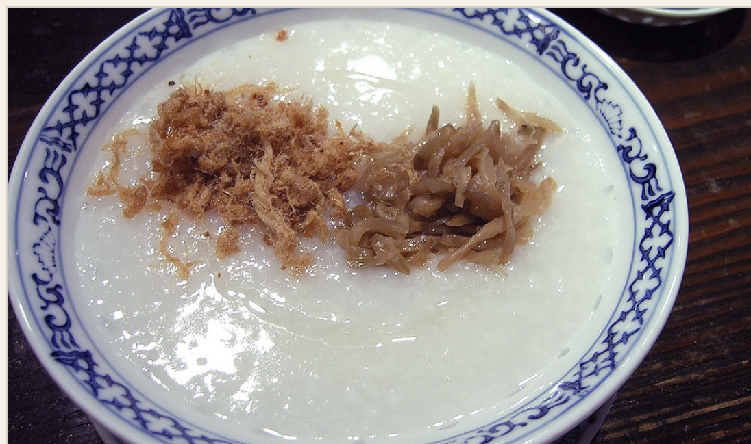
TIU CHEW CONGEE