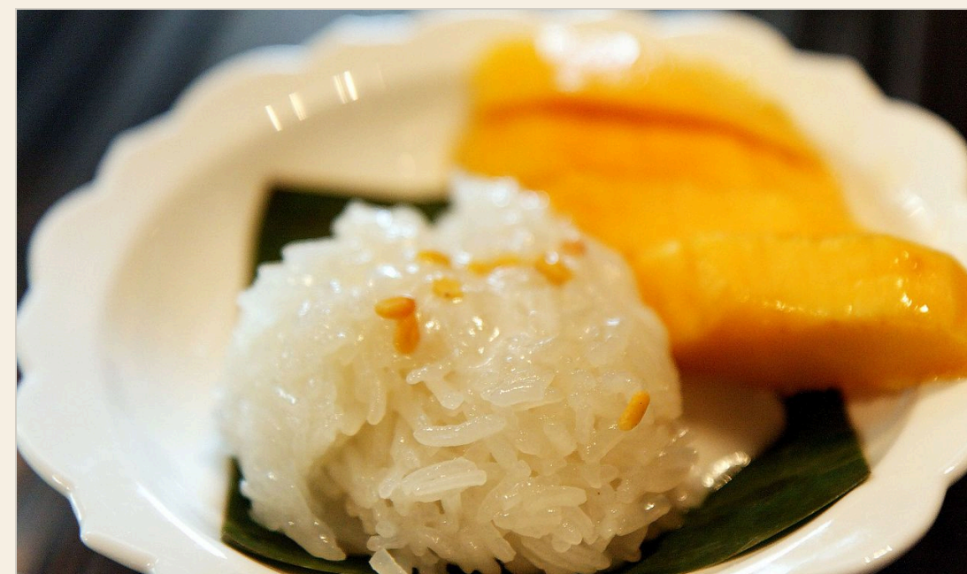
MANGO STICKY RICE